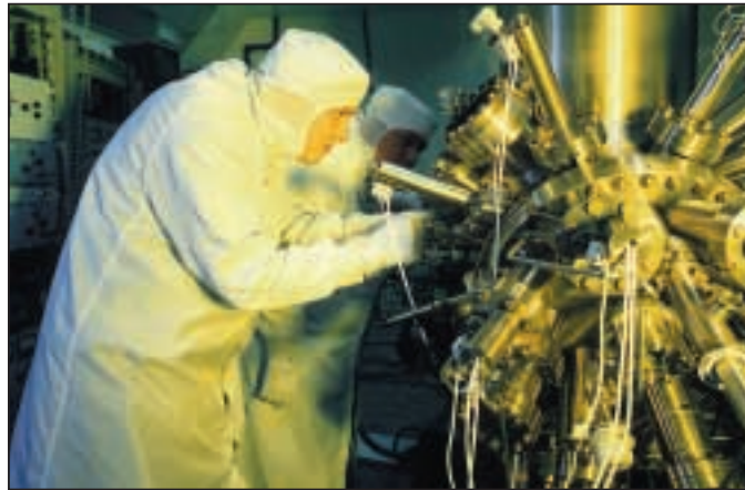
Mikroelektronikan laboratoriossa on komponenttien valmistukseen tarvittavat puhdistilat.

män taakse antaa komponenttien käyttäjille uuden tehokkaan työvälineen.