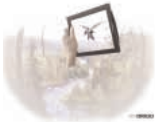
Tulevaisuuden viihdepelejä ei pelata pöydän ääressä istuen, vaan pelaaja lähtee oikeasti liikkeelle. Tässä Vihollinen hyökkää Kuusamon korvessa. In the future games get mobile.

Viihdepelit ovat yksi tulevaisuuden mediapuhelimen lupaavimpia sovellutusalueita. Erityisesti nuorisolle suunnatuissa mediapuhelinmalistoissa on suuria volyymi- ja liiketoimintamahdollisuuksia.