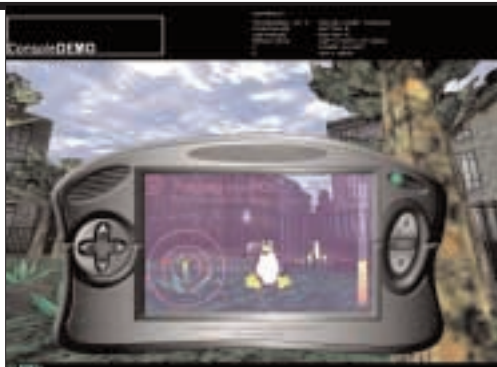
"Catch the Penguin" on Oulun yliopistossa tuotetun ensimmäisen pelidemon prototyypin aihe. Turvallisuussyistä peli ei toimi kuin kaupungin puistossa. Pyydytettävät pingviinit voi nähdä läpikatsottavan näytön avulla. Catch the Penguin is the first game demo developed.