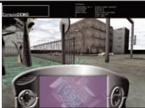
Pelaaja voi saada pelikonsolin näytölle myös opasteita erilaisista näkökulmista. Prototyypin jälkeen pelin sisältöä kehitetään pelisuunnittelun ammattilaisten kanssa. The player can get hints of different viewing angles on the screen.

jotakin todellista paikkaa vastaava virtuaalimaailma. Peli voi olla joko erikseen käynnistettävä tai jatkuvasti käynnissä oleva virtuaalimaailma.